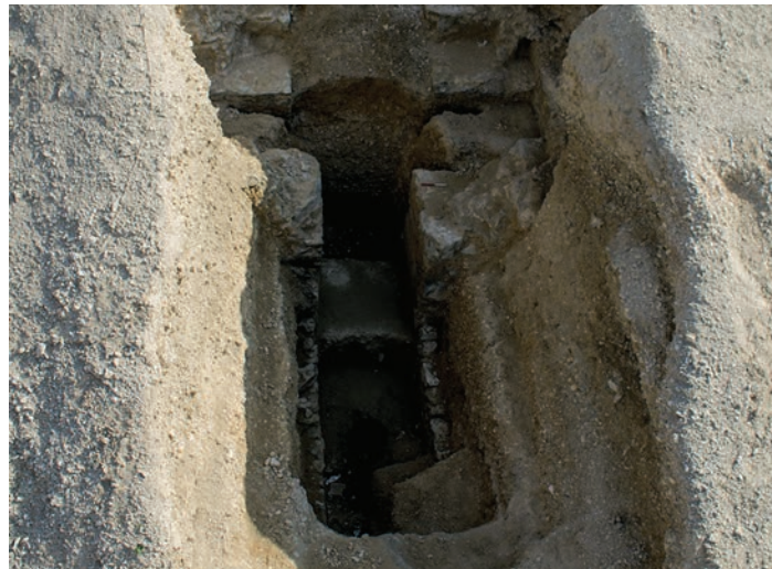
Nécropole d'A'ali au Bahreïn, tombe 29