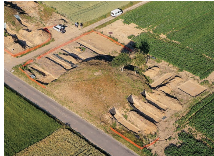
Aperçu général des sondages archéologiques de 2018. Tumulus de Seron à Fernelmont, province de Namur