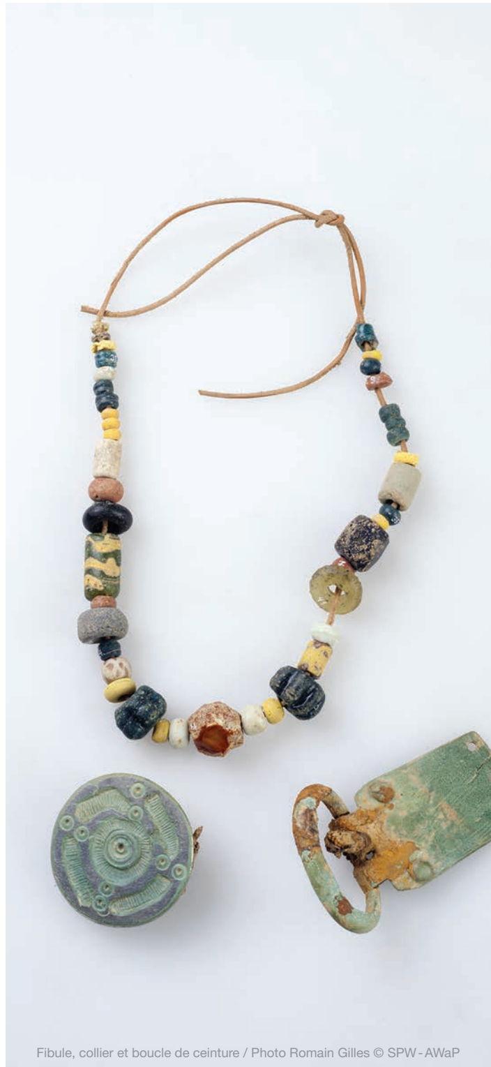
Fibule, collier et boucle de ceinture