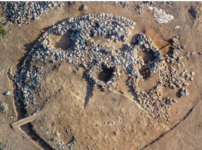
Tumulus de l'Anavlochos en cours de fouille / Orthophotographie © EFA / Mission Anavlochos