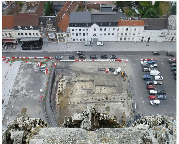
Saint-Amand (Nord) - Vue, prise du haut de la tour abbatiale, du chantier de la Grand-place en fin d'opération