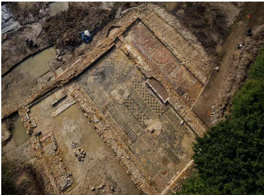
Saint-Martin-d'Hardinghem (Pas-de-Calais) photo aérienne des pavements